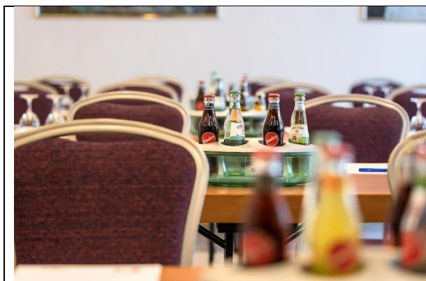
Hotel Europa, Tagungsraum