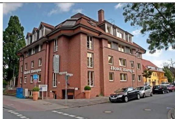
Hotel Europa in Münster