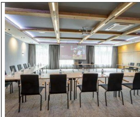
Best Western Hotel, Tagungsraum

21.11. – 23.11.2024 (Teil 1) 29.11. – 30.11.2024 (Teil 2)