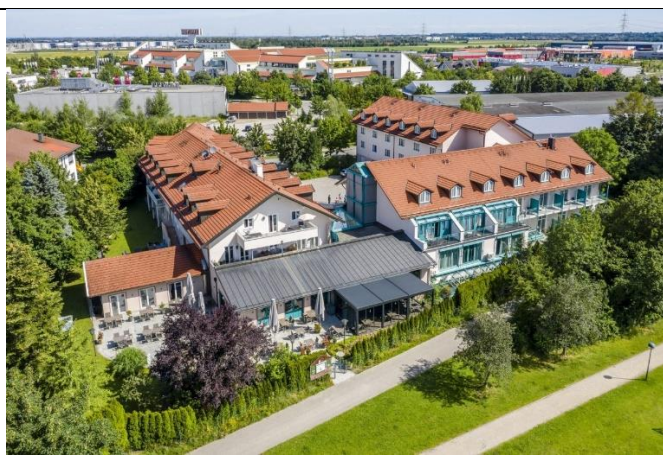
Best Western Hotel in Parsdorf